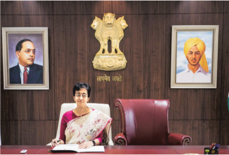
AAP leader Atishi took charge as Delhi's chief minister on Monday, keeping the chair used by her predecessor Arvind Kejriwal empty and "waiting for him", a move the BJP and the Congress said was a "grave insult" to the post. Three ministers also took charge of their respective departments